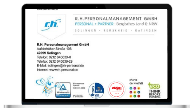
Verwendung in der E-Mail-Signatur